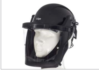
Dräger X-plore® 8000, Capacete com