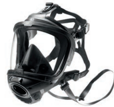
Dräger X-plore® 8000 Vizörlü kask