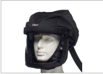
Dräger X-plore® 8000 Koruyucu vizör

Vizörlü ve koruyucu vizörlü Dräger X-plore® kasklar, respiratörün entegre bir çözümlü olarak göz koruması ve kafa koruması (sadece vizörlü kasklarda) ile en zorlu işleri bile çok daha kolaylaştırır. Ayrıca koruyucu vizör, başınızı toza karşı koruyan kumaş başörtüsü ile donatılmıştır.