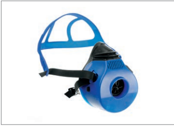
Dräger X-plore® 4790, silikon

Dräger X-plore 4700 ailesi olarak, en sert koşullarda kullanılmak üzere tasarlanmış sağlam ve dayanıklı yarım maskeleri sunuyoruz. Kolay takıp çıkarmak ve aynı zamanda rahat kullanım için onaylı FlexiFit kafa bandı ile donatılmıştır.