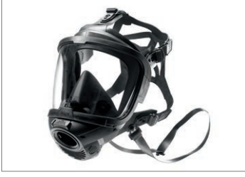
Dräger FPS 7000, Tam yüz maskesi

Dräger X-plore 6300, 6530, 6570 ve Dräger FPS 7000 tam yüz maskeleri yenilikçi güvenlik ve konfor standartları sunar. Bu tam yüz maskeleri, kişilerin yüzüne tam oturan çift dikişli çerçeve sayesinde güvenilir dar kesimi ile sizlere en yüksek koruma seviyesi (TM3) sunar.